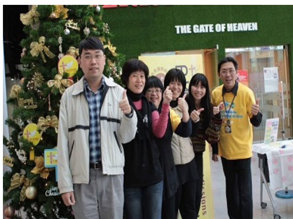
泰短宣：六位巴拿巴宣教學院學員 +